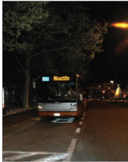
Midi, le long de l'axe Nord-Sud.

Le point névralgique de Noctis est la place De Brouckère. C'est de là que se déploie chaque vendredi et samedi soir un réseau de bus qui s'épanouit en étoile du centre-ville vers les faubourgs. Afin de toucher un maximum de gens dans le plus de quartiers possible, le réseau en étoile a été complété par une double ligne circulaire (Midi-Midi) portant le numéro N66 dans un sens et N99 dans l'autre. En correspondance avec chacune des 20 autres lignes, cette dernière dessert une couronne située entre la Petite et la Grande Ceinture, en passant notamment par Simonis, Belgica, le site de Tour et Taxis, la barrière de Saint-Gilles, Ma Campagne et La Chasse. La ligne N30 assure, quant à elle, la navette entre Rogier et la Gare du