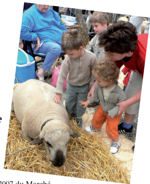
L'édition 2007 du Marché annuel jettois, agrémentée d'ambiance, de musique, de bonnes affaires et de bons petits verres, fut une fois encore un grand succès.

Les petits citadins ont découvert le monde impressionnant des animaux ou fait des tours de moulin à la kermesse tandis que les adultes se sont lancés à la recherche de bonnes affaires. Pas mal d'animation au programme! Cette année, pour la première fois, un village médiéval a été construit dans le parc Roi Baudouin lors du week-end précédent le marché annuel. Les chevaliers en armure n'ont pas manqué de public. Sur la place Reine Astrid, un concours s'est terminé par l'élection des plus beaux chiens, des tournois ont ravi les sportifs, le tout au son de la musique. Ainsi, les accords mélodieux des jeunes talents de Fiestajet ont envahi le parc Garcet.