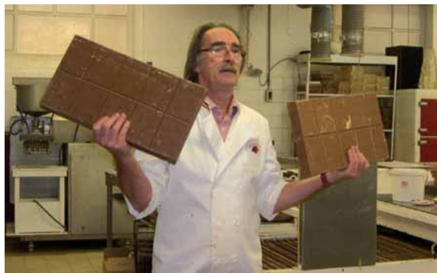
Photos : Le Chocolatier Manon (magasin) - rue du Congrès 24 - 1000 Bruxelles