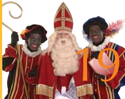
3 décembre 2011 Saint-Nicolas à Jette