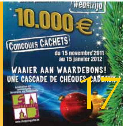
Grand concours Shopping Jette