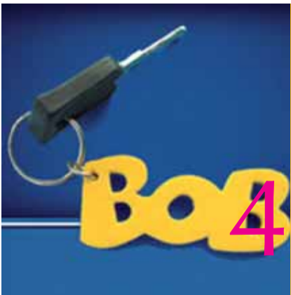
Nouvelle campagne Bob