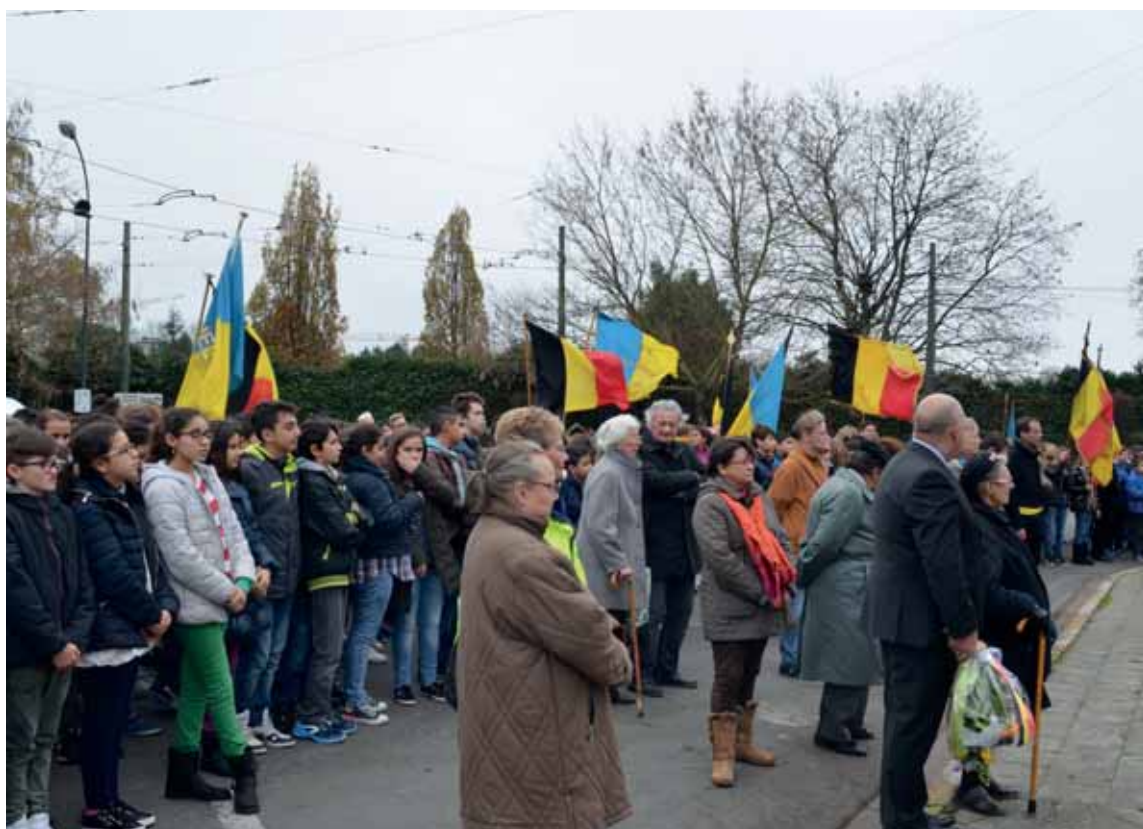
Une initiative de l'échevin des Aniens Combattants Geoffrey Lepers