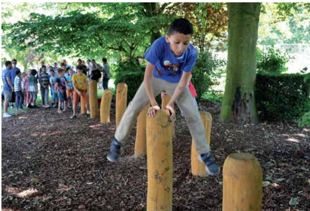
Piste de santé Parc de la Jeunesse

Pendant l'inauguration, les élèves de l'accueil extrascolaire ont montré avec enthousiasme le bon exemple. Voilà la preuve que les jeunes, autant que les aînés peuvent se défouler grâce à la piste de santé. Un must pour ceux qui aiment l'exercice et la nature.