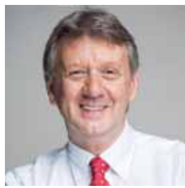
Hervé DOYEN Bourgmestre LBJETTE