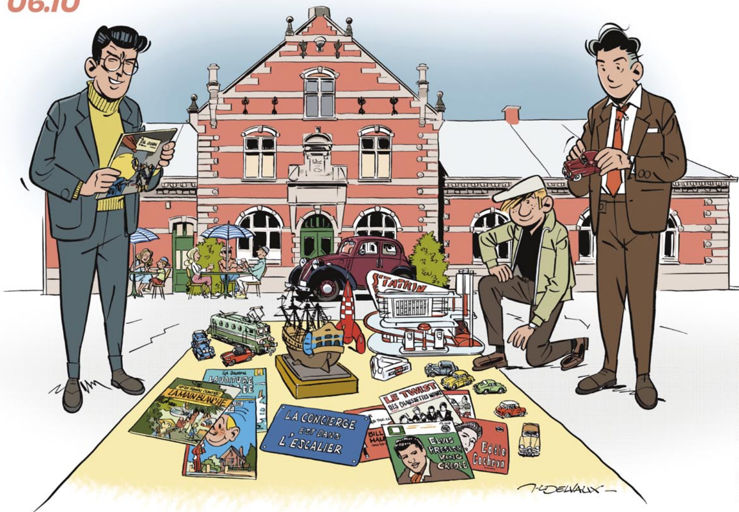
E.B.N.U. - BGM - Chaussée de Wemmelsteenweg 100 - 1090 Jette