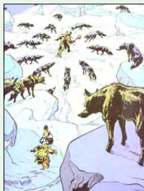
Copyright Le Lombard (Dargaud-Lombard sa) D'arb job - 2003

De zomertentoonstelling van de "Foyer culturel jettois" is gewijd aan de wolf die, in de levendige verbeelding van de mens, steeds een ambigu imago heeft gehad. Deze tentoonstelling, getiteld "De Wolf, mythes en waarheden", vertelt de bewogen geschiedenis van de wolf in onze streken en situeert het dier in zijn natuurlijke omgeving. U kan er dit prachtig dier ontdekken in al zijn facetten, op panelen gerealiseerd door specialisten, op zeldzame stukken uit verschillende musea, met een voordracht, video's en allerhande documenten.