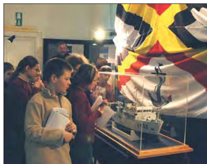
"Navexpo 2005: Matrozen & stormen"

De organisatie, in handen van het Centre culturel de Jette, in samenwerking met de gemeente Jette en de Navexpoploeg, kan rekenen op een belangrijke samenwerking met de Marine, net als op de steun van de Haven van Brussel en van Dexia. Musea, uitgevers, professionele verenigingen, schilders en jeugdbewegingen dragen eveneens bij tot een succesvolle Navexpo 2005. De bezoekers kunnen de tentoonstelling individueel bezoeken of kunnen een geleid bezoek reserveren. Voor de scholen worden er eveneens specifieke geleide bezoeken georganiseerd.