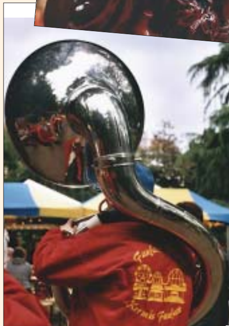
...en de tonen van de traditionele filharmonie- en fanfaremuziek.