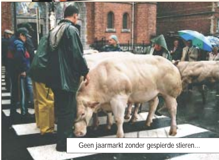
Geen jaarmarkt zonder gespierde stieren...