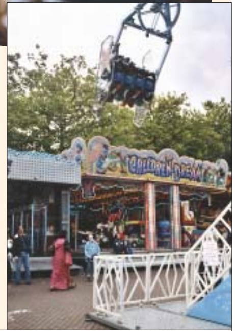
Regen en zonnestralen, 'kermis in de hel' heet dat in de volksmond.