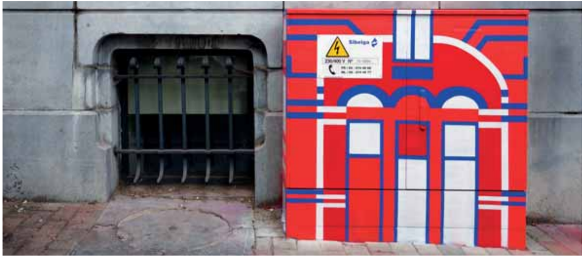
Een voorbeeld van een artistieke Sibelgacabine in Ukkel. Binnenkort ook te zien in het Jetse straatbeeld.