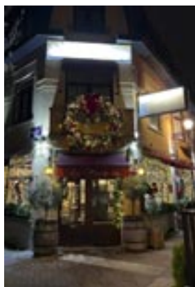
1 ste prijs La Penisola Restaurant P. Timmermansstraat 63