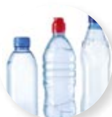
7. Een plastic fles