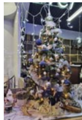
3 de prijs Jetexpress Reisbureau Koningin Astridplein 2