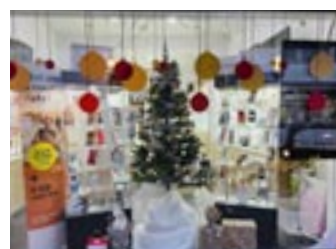
5 de prijs i-Shop Informatica/telefonie Léon Theodorstraat 8