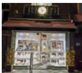
4 de prijs Or-Fée Juwelier Koningin Astridplein 10