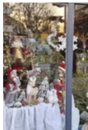
2 de prijs Chanson Brood- en banketbakkerij G. De Greeflaan 55