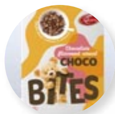
5. Een kartonnen verpakking van ontbijtgranen