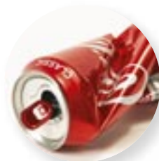
3. Blikje cola