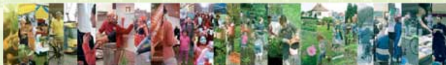
RÉSEAU DES QUARTIERS DURABLES - NETWERK DUURZAME WIJKEN

De begeleiding voor « Duurzame Wijk » is bedoeld om de bewoners te helpen om hun gedrag te veranderen en om een groene stempel op hun omgeving te drukken met als uiteindelijke doelen: het beschermen van de planeet en het ontwikkelen van het welzijn van iedereen.