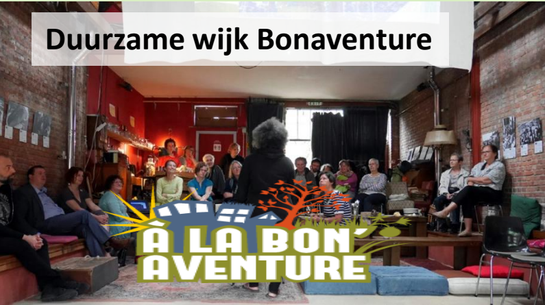
Duurzame wijk Bonaventure