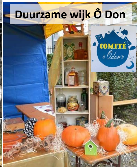
Duurzame wijk Ô Don