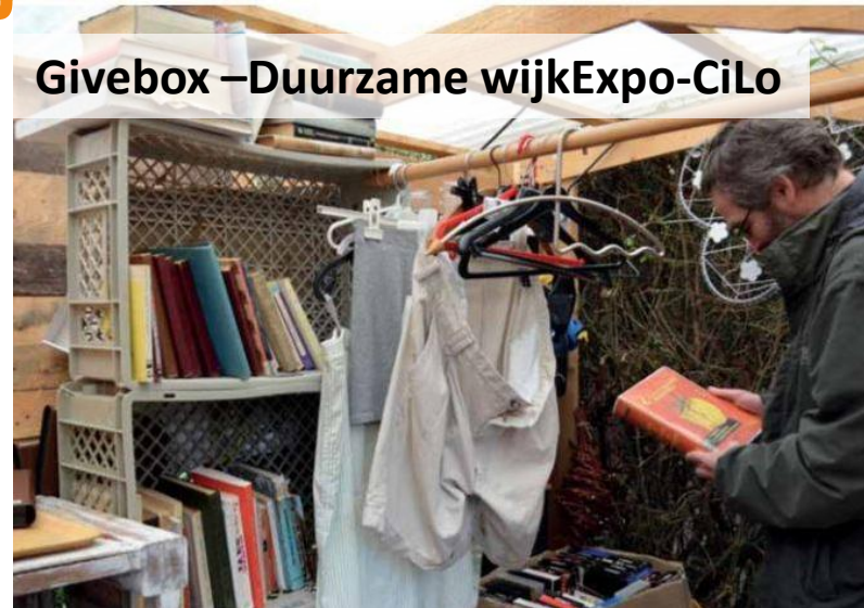
Givebox –Duurzame wijkExpo-CiLo