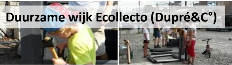
Duurzame wijk Ecollecto (Dupré&C°)